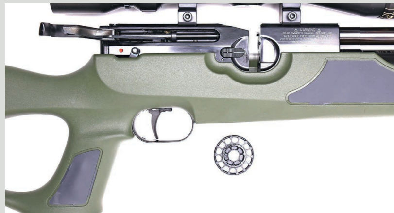
Abb. zeigt Farbvariante olivgrün Pic. shows color variant olive drab

More technical data you can find in our catalogue or on our website.